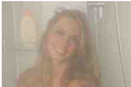
Entspannung im Dampfbad